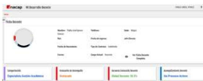
Evaluación de desempeño docente por año

Nota: en esta imagen se muestra el resumen de la evaluación docente 2024 con un global del 92,6% de satisfacción por parte de los alumnos con el docente.